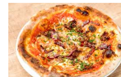
馬肉のピッツァディアボラ 跳ね馬風