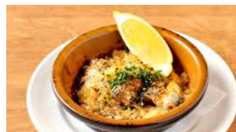
オイルサーディンのにんにくバター焼き