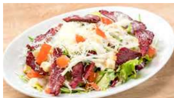
カリカリ馬ハムのシーザーサラダ