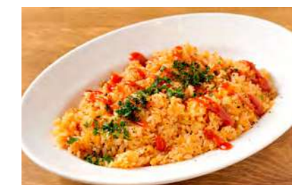
ガーリックホースライス(赤)