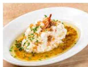
アンチョビポテト