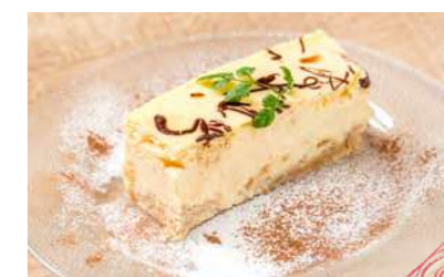
濃厚チーズケーキ