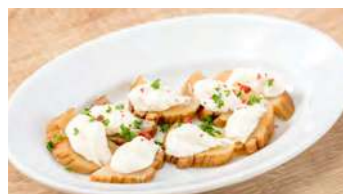
いぶりがっことクリームチーズ