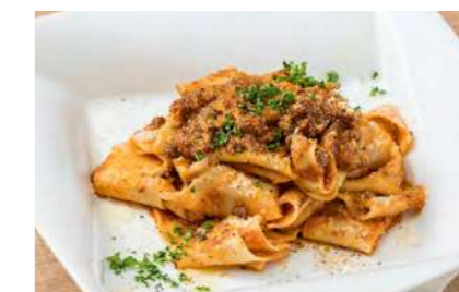
馬肉のポロネーゼ パツパルデッレ