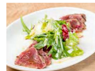
馬肉の炙りカルパッチョ