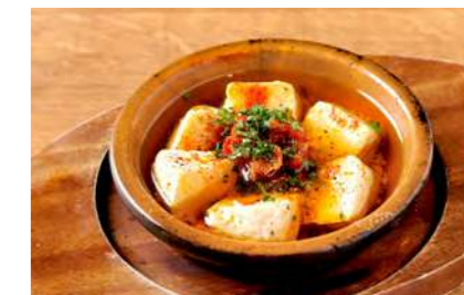
カマンベールチーズのアヒージョ